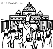
St. Leo the Great

St. Leo the Great was born in Tuscany. He is well known for his great eloquence and writing skills. He is known as one of the best administrative popes of the ancient church. He was the first pope to receive the title "the great." During the 5 th century barbarian invasion, he even persuaded Attila the Hun to turn back at the gate. He died in 461 and his feast day is November 10. Come join us at the Wednesday night TEEN Night to increase your knowledge of this great saint.